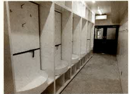
【防火衣装着室】 迅速に出動できるよう、車庫と隣接しており、この場所で防火服に着替えて災害現場に出動します。