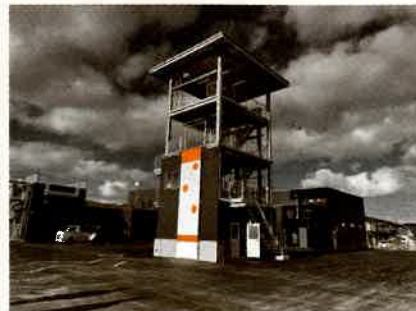
【訓練塔】 消火・救助訓練などの他、庁舎棟と連携することで多目的な訓練を行うことができる施設です。