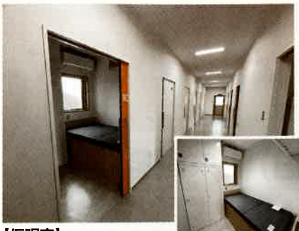
【仮眠室】 個室化し、ストレス軽減とプライバシー保護を図ります。また女性職員が働きやすいように専用室を設けました。 (専用の仮眠室・シャワー室等)