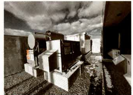
【非常用発電機】 大規模な災害等により停電になっても、防災拠点としての機能を維持できるよう整備しました。(72時間運転可能)