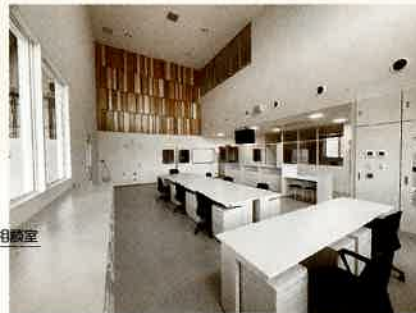
【事務室】 コンパクトで機能的な執務環境を実現しました。