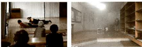
(写真:相坂上講会堂で行った訓練の様子)