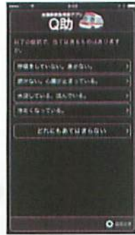
視覚効果「明度反転」