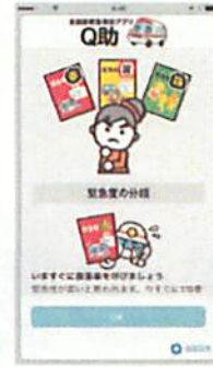
緊急度の分類説明