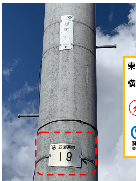
東北電力、NTT共同電柱

上十三消防指令センターでは、119番通報の際に、住所や目標物等がわからず、今いる場所が伝えにくい場合に、電柱に表示されている電力会社の管理番号『電柱番号』を伝えていただくと、場所が特定できるようになりました。