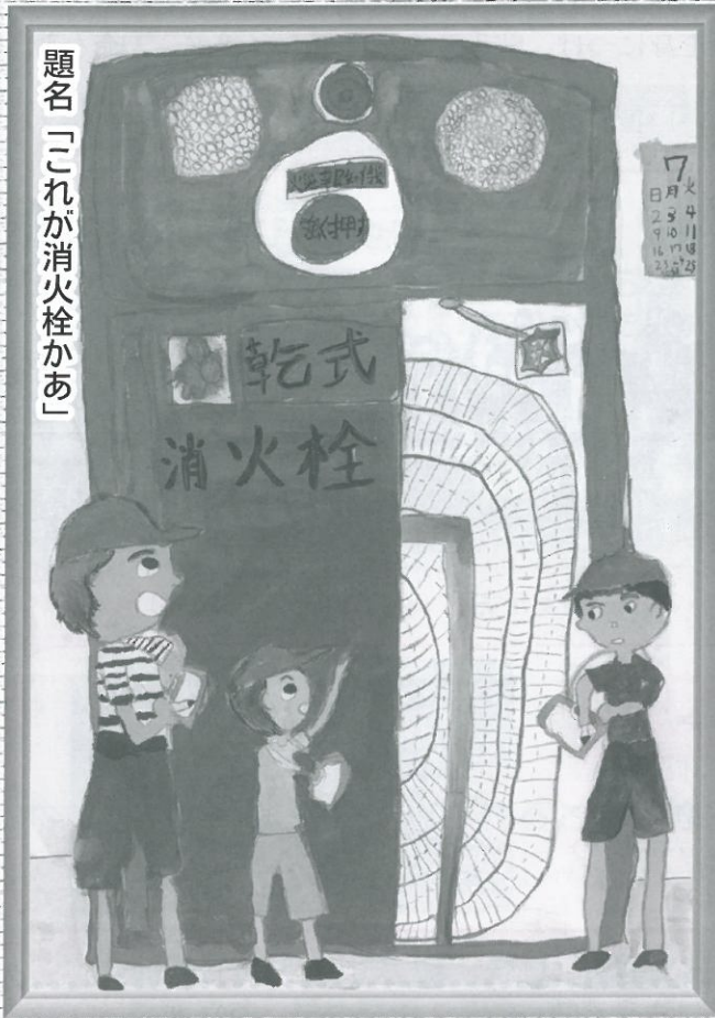
題名「これが消火栓かあ」

管内小学生の防火図画・標語作品の中から最優秀賞が決定しました。 これらの作品は、今後1年間管内（十和田市・六戸町）の防火ポスターとして使用されます。