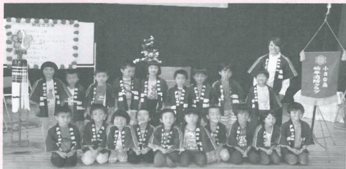
小さな森こども園（6月1日結成式）

今後は、消防訓練や各種行事に参加し、地域防災のかわいい担い手として活躍します。ご声援よろしくお願ひします。