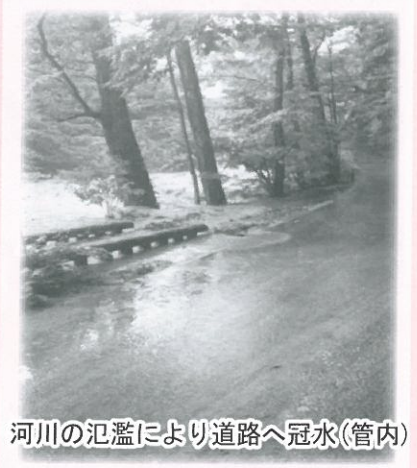
河川の氾濫により道路へ冠水(管内)