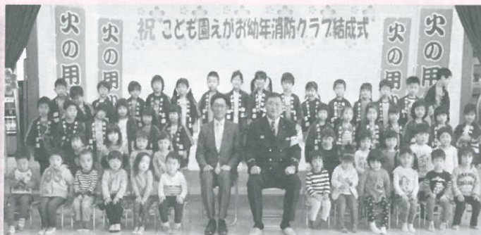
こども園えがお（4月10日結成式）