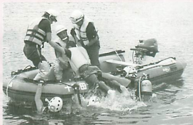
ボートを使用した訓練にも余念がありません。