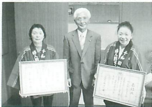
十和田市長(中央)に受賞報告をする米田委員長(左)、張摩委員長(右)

この表彰は、地域安全のために適切な活動を行い、災害の発生防止又は被害軽減に功績のあった団体に贈られます。全国で11団体のうち、十和田市の2団体が受賞しました。