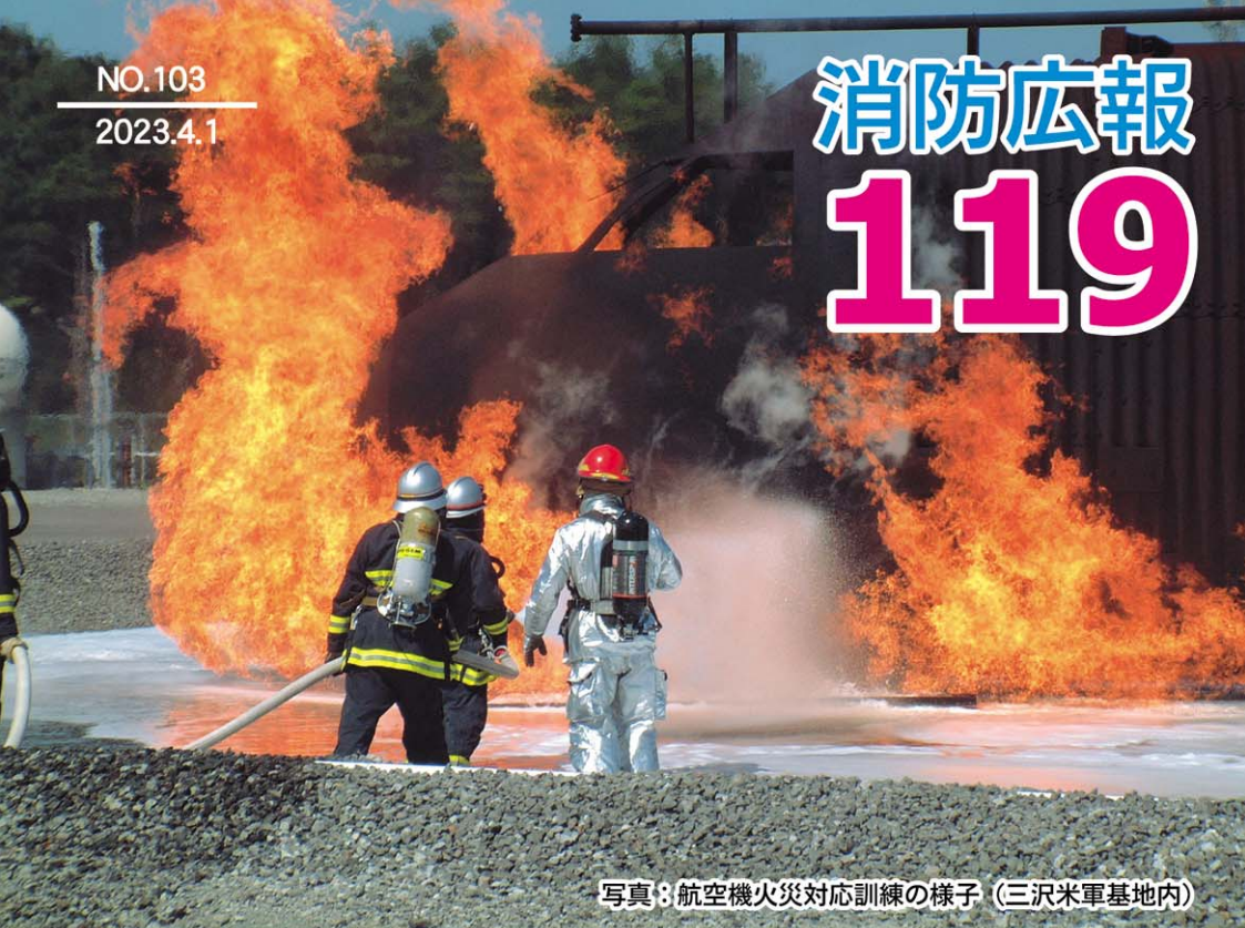
写真8 航空機火災対応訓練の様子 (三沢米軍基地内)