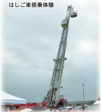
はしご車搭乗体験