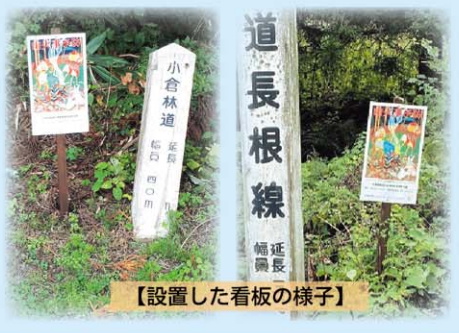
【設置した看板の様子】