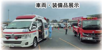
車両・装備品展示