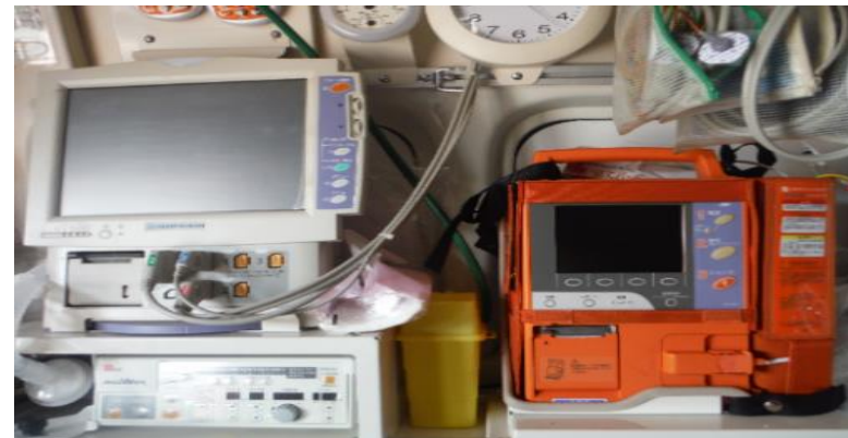
【左:ベッドサイドモニター 右:半自動式除細動器】