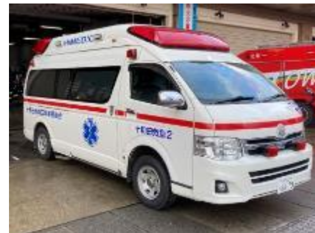
【現行車両:十和田救急2】