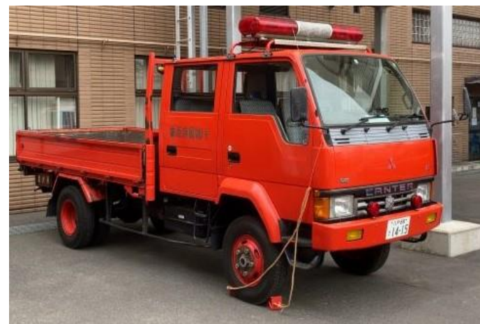
【現行車両:資材搬送車】